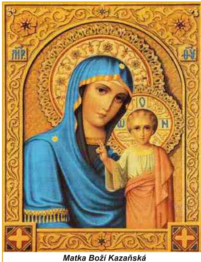
Matka Boží Kazaňská